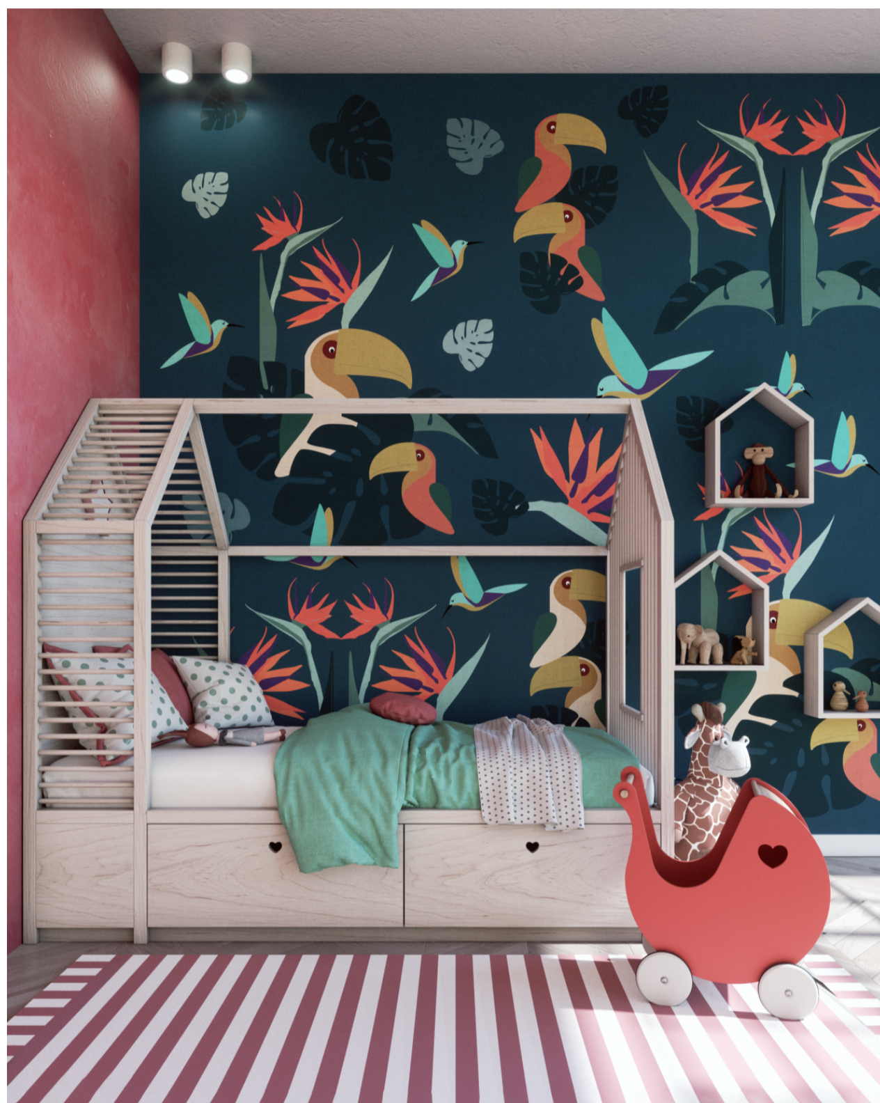
Linea be Natural di beWall. Design by Marta Palmisano

Lo psicologo Howard Gardner noto per la teoria sulle intelligenze multiple sostiene anche che l'educazione non è un processo esclusivamente scolastico ma deve ruotare intorno a tre componenti: verità, bellezza e morale . Anche l'educazione alla bellezza parte dalle mura domestiche e ciò che ci circonda e che vediamo ogni giorno è determinante nello stimolare curiosità ed attitudine verso concetti come armonia, coerenza estetica, creatività negli accostamenti, eclettismo.