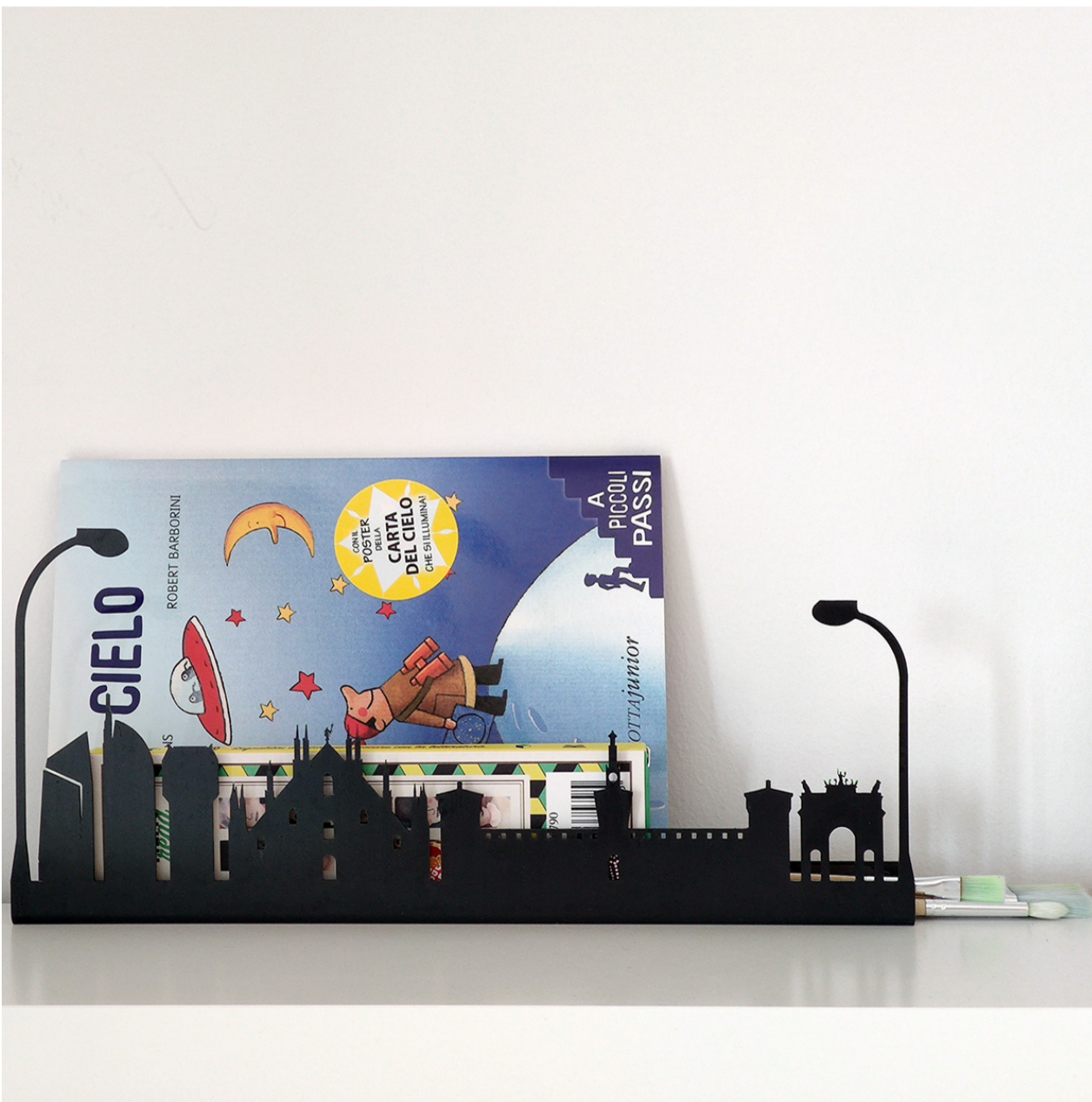
I complementi di Caoscreo in metallo sono costruiti consapevolmente e permettono di creare ordine con originalità

Nell'era della transizione ecologica l'utilizzo di materie prime riciclabili unito ad una produzione on demand che riduca al minimo gli sprechi rappresenta una buona filosofia aziendale. I complementi di Caoscreo in metallo sono costruiti consapevolmente e permettono di creare ordine con originalità.