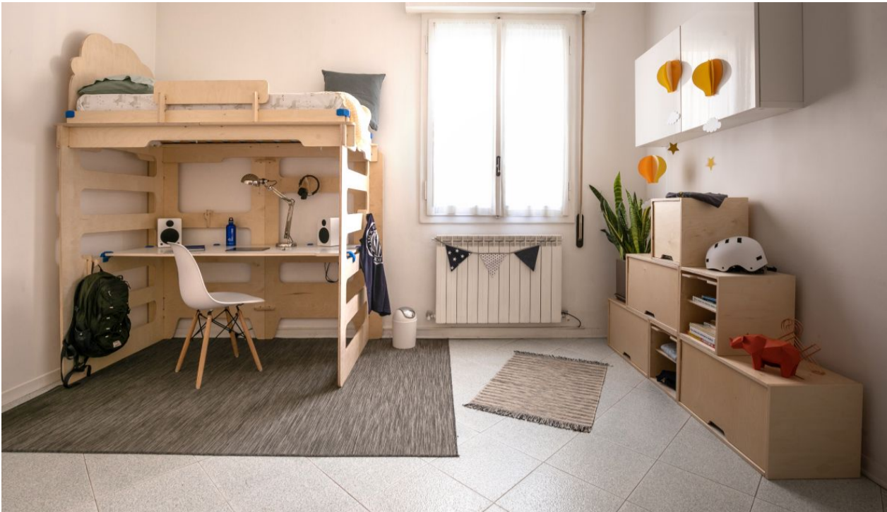
PlayWood, le camerette in armonia con la natura