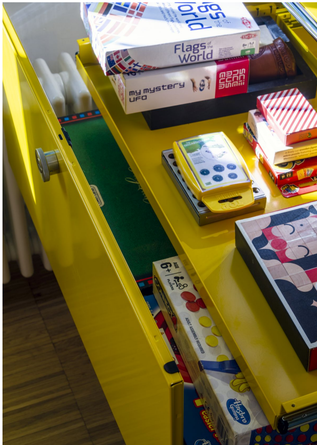
USM Haller realizza spazi con una serie di moduli combinabili e configurabili liberamente